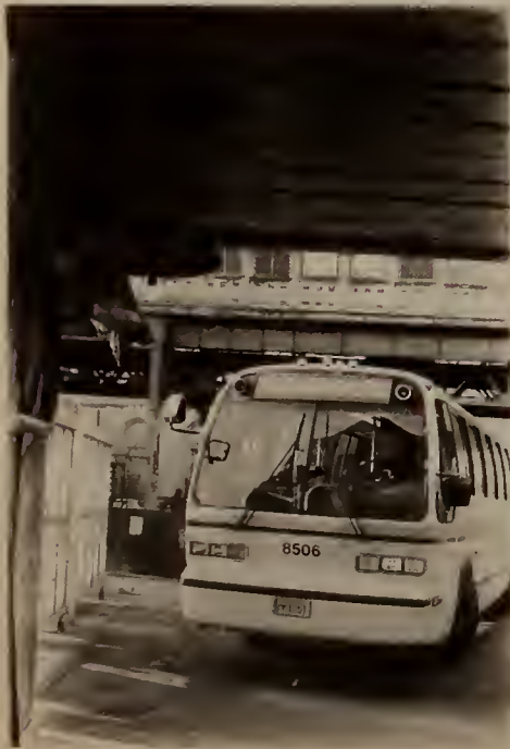
MBTA Bus at Dudley Station